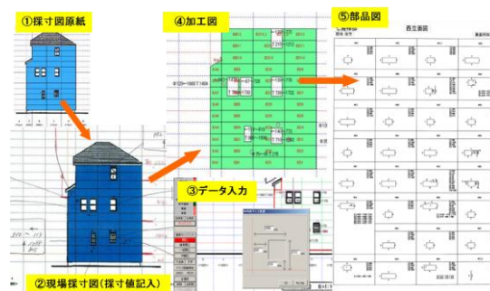
図4 図面作製システムの概要