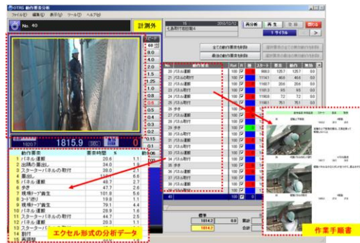
図3 ビデオ分析ソフト