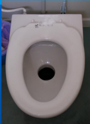
超々節水型トイレ (洗浄水量600ml/回)