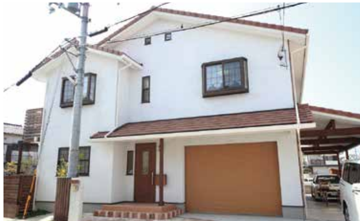
屋根の色をデッキと統一し遊び心を取り入れた外装