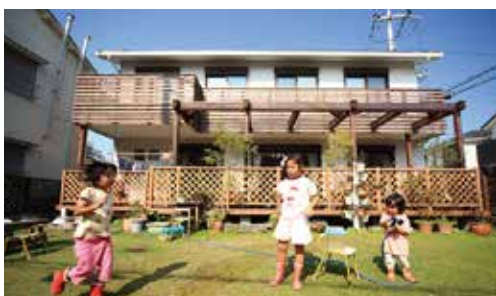
広い庭で、はしゃぐ子ども達を見られるのが幸せ