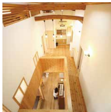
吹抜けからいつでも家族を見守れるように