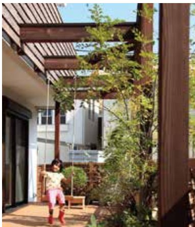
手作りのプランコは子ども達のお気に入り

夏場の室内に侵入する日射量が多いと室内に熱がこもり、エアコンへの負担が大きくなります。日射の侵入が特に大きい窓に、障子や外付けブラインド等を設置することで省エネにつながられます。